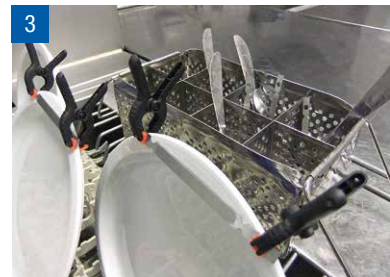
Indikatoren am Teller befestigt