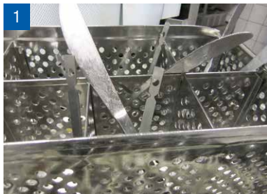
Indikatoren im Besteckkorb

Die Geschirrspülmaschinen werden für die periodische Prüfung ganz normal mit Essgeschirr und Besteck beladen. Die Bioindikatoren (Edelstahlplättchen) werden zum Besteck in den verschiedenen Besteckkörben oder auf den Besteckbändern verteilt. Zur Prüfung der Reinigungs- und Desinfektionsleistung des Essgeschirrs werden die Indikatoren an den Tellern befestigt.